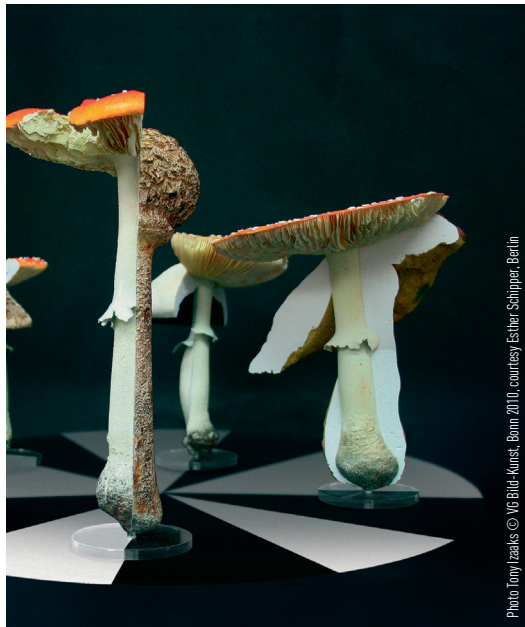
Carsten Höller Doppelpilzlehr (2010), exposé dans Soma

Carsten Höller au Double Club, le night-club londonien mi-occidental, mi-congolais qu'il a aménagé