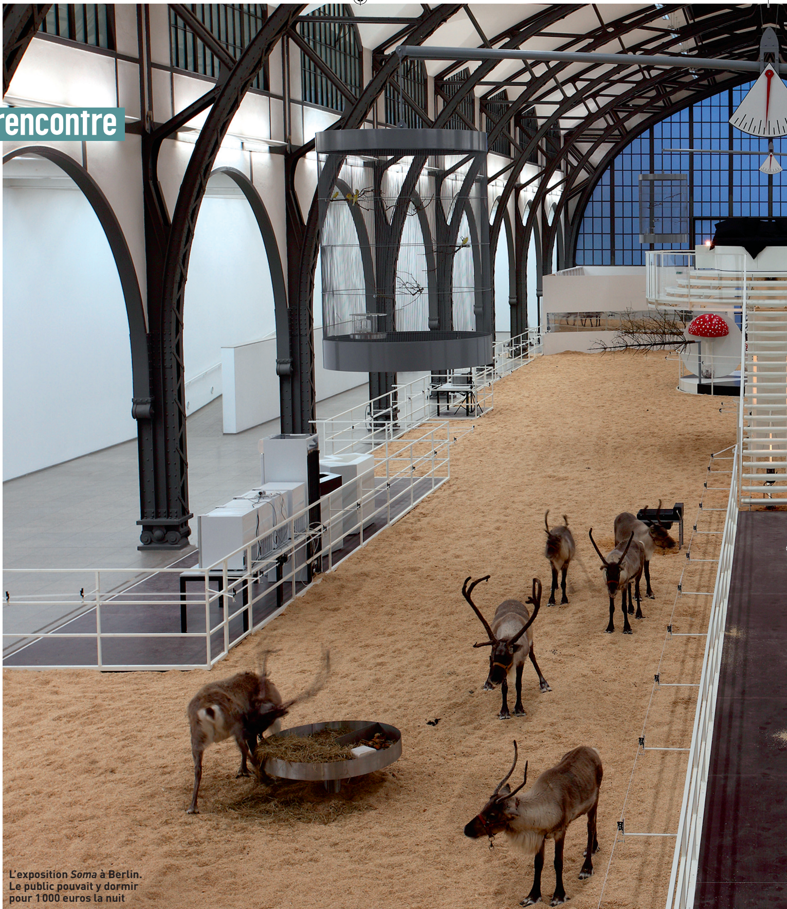
L'exposition Soma à Berlin. Le public pouvait y dormir pour 1000 euros la nuit