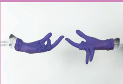
Rebecca Farnelle, courtesy galerie Chantal Crousel

A la galerie Chantal Crousel, 10, rue Charlot, Paris III e , tél. 01.42.77.38.87, www.crousel.com