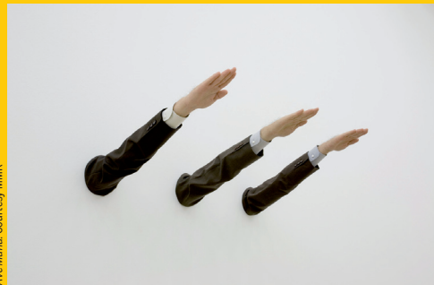
Ave Maria.

Le trublion Maurizio Cattelan fait des siennes cet été à Francfort où il présente une œuvre inédite par mois, depuis juin jusqu'en septembre, dans et aux alentours du Museum für Moderne Kunst et du centre d'art Portikus.