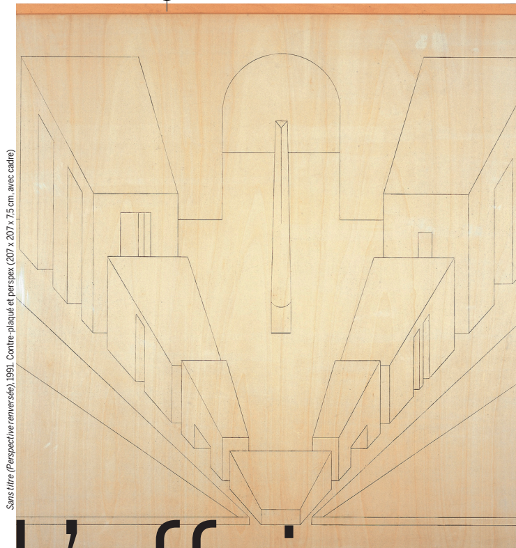
Sans titre (Perspective renversée), 1991. Contre-plaqué et perspex (207 x 207 x 7,5 cm, avec cadre)

À la Serpentine Gallery, Kensington Gardens, London W2 3XA, www.serpentinegallery.org