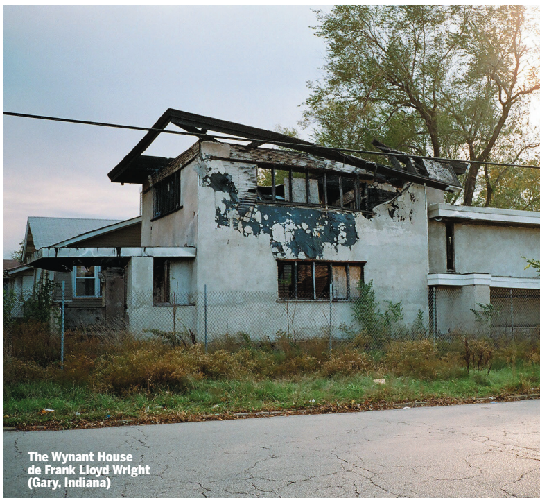
The Wynant House de Frank Lloyd Wright (Gary, Indiana)